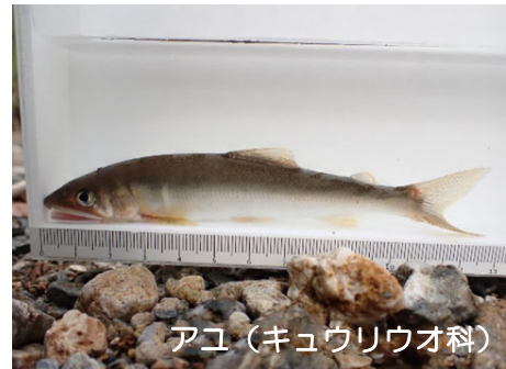
アユ（キュウリウオ科）

河川ではとりわけ、縦断方向の連続性を保全することが重要である。人の手の加わっていない原生の自然では、源流域から河口まで一連の流路があり生物は自由に川を遡上・降下できる。また、食物連鎖（食う食われるの関係や相互作用）も、源流部から下流にかけて鎖のように繋がっている。川の生物に目を向けると、例えば、アユに代表される回遊魚は、産卵は河川中下流域、稚魚期は沿岸域、成長期は河川下流～上流域と一生の中で河川と沿岸域の広い範囲を生活の場としている。